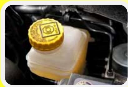
Rem vloeistof (voetrem)